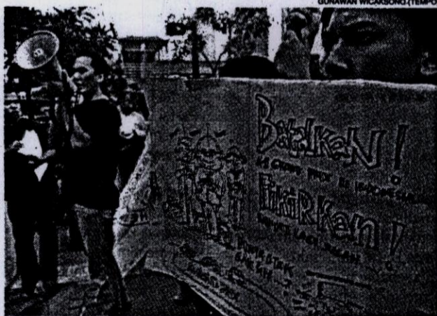
TOLAK A1. Kelompok Jaringan Mahasiswa Hukum Indonesia menggelar unjuk rasa menolak penyelenggaraan balap mobil A1 yang berbau kolusi di Jakarta kemarin.

Jeffrey menjelaskan, perusahaan tambang hanya memberikan sumbangan sukarela karena tidak dapat ikut memasang iklan. Biaya iklannya cukup mahal, antara Rp 750 juta dan Rp 3 miliar. ● ALLIYUR YASIN | MUHAMMAD FASABEN