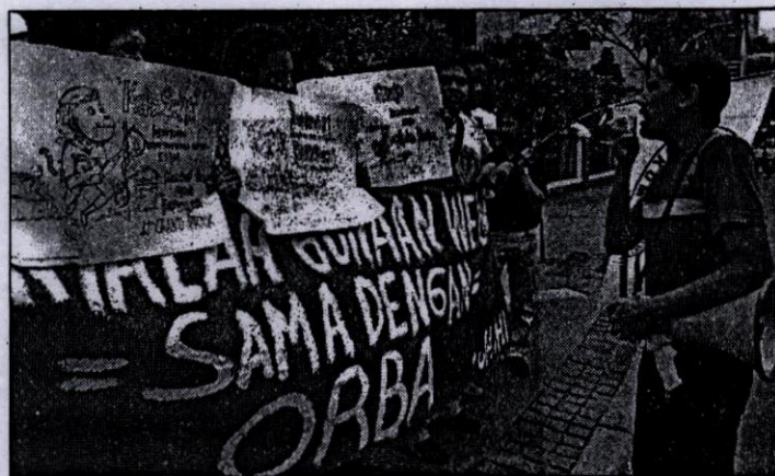
UNJUK RASA - Sejumlah mahasiswa yang mengatasnamakan Jaringan Mahasiswa Hukum Indonesia berunjuk rasa di depan Kantor Menteri Energi dan Sumber Daya Mineral (ESDM), Jalan MH Thamrin, Jakarta, Selasa (3/1). Dalam aksinya mereka menuntut pembatalan rencana penyelenggaraan Balap Mobil A1 Grand Prix di Indonesia serta pengusutan tuntas praktek KKN serta penyalahgunaan wewenang di dalam lembaga ESDM.