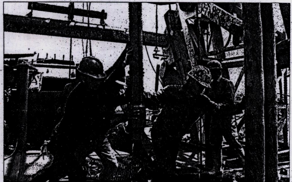
PENGARUH MINYAK - Beberapa pekerja memindahkan bor di sumur minyak yang memiliki cadangan lebih dari 200 juta barel, di Tambun, Bekasi, Jawa Barat, beberapa waktu lalu. Sepanjang 2005, perekonomian nasional sangat dipengaruhi harga minyak dunia. Diperkirakan faktor yang sama masih akan membayangi perjalanan ekonomi sepanjang 2006.

Meski secara tersurat ada gambaran optimisme bahwa perekonomian 2006 lebih baik dari sebelumnya, pemerintah tetap menyadari sejumlah kondisi riil yang dihadapi bakal menjadi tantangan dalam rangka pencapaian target-target ekonomi yang dituangkan