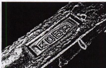
Batangan timah dan tambang Koba Tin (bawah)

Sebulan lebih berlalu, sampai pekan ini, surat Kapolri itu sepertinya belum mendapat respons menggembirakan. Masih adem saja. Tampaknya barulah sekadar