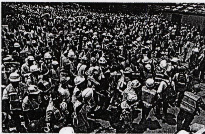
MOGOK: Ribuan pekerja PTFI saat melakukan long march di Mimika, kemarin. Akibat aksi ini, aktivitas pertambangan di PTFI nyaris lumpuh.