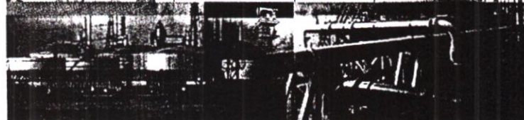
ENR17 BESI DAN ARIH