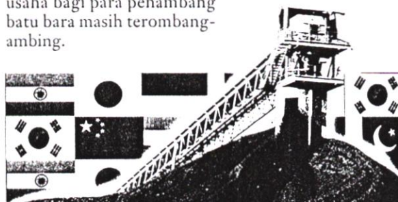
Cadangan, Produksi, dan Konsumsi Batu Bara di Asia Tahun 2000

Memang, sudah muncul berbagai pernyataan yang menyejukkan dari Menteri Lingkungan Hidup, Nabel Makarim, serta Menteri Negara Percepatan Pembangunan Kawasan Indonesia Timur, Manuel Kaisiepo. Dua menteri itu memilih mengizinkan penambangan di areal hutan, Juni lalu, ketimbang mencabut izin, tapi dengan risiko pemerintah digugat perusahaan tambang. Meski demikian, selama Undang-Undang Kehutanan belum diamandemen, kepastian berusaha bagi para penambang batu bara masih terombang-ambing.