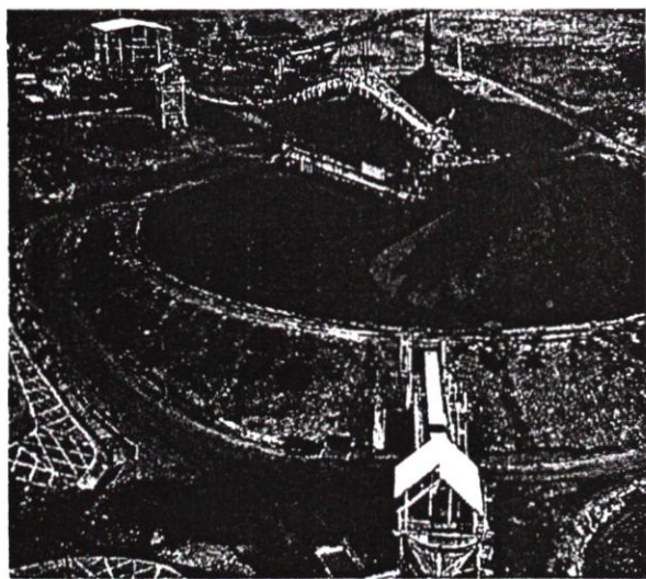
Pengolahan batu bara; Terlalu banyak peraturan